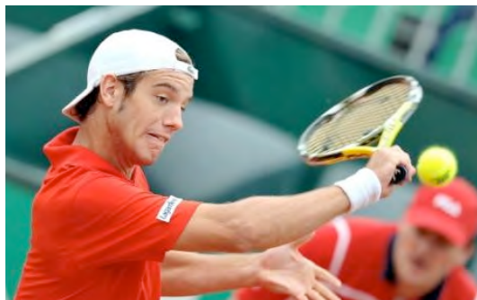
Richard Gasquet aux Internationaux de France à Roland Garros en 2006

Richard Gasquet est considéré comme un joueur particulièrement complet et doué techniquement possédant la plupart des coups du tennis. Il s'adapte à toutes les surfaces, ce qui lui a permis de remporter des tournois ATP à la fois sur terre, herbe et synthétique. De nombreux journalistes reconnaissent la qualité de son revers à une main. Et continueront à croire en Richard Gasquet.